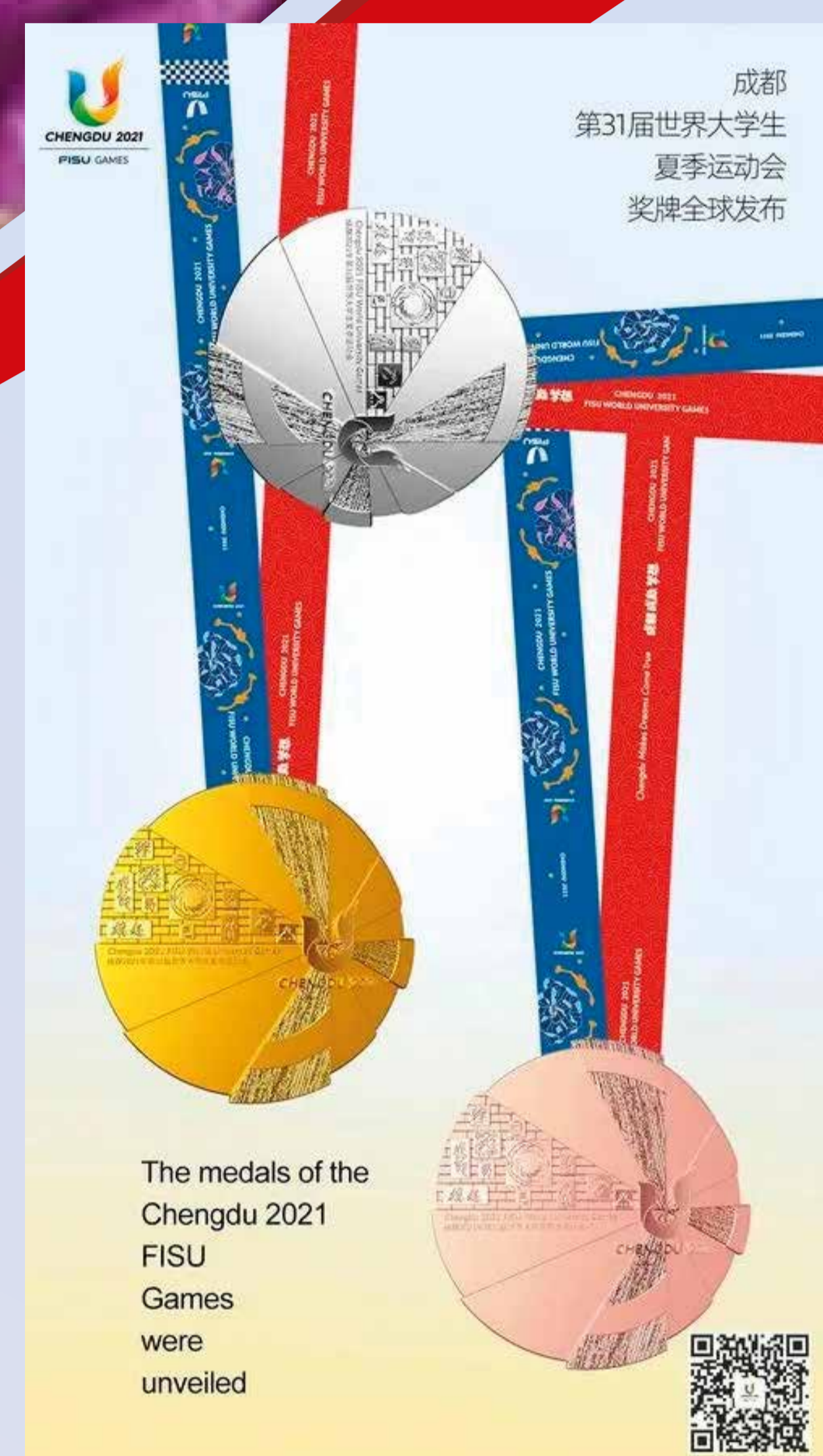
大运会奖牌绶带总设计师

第31届世界大学生夏季运动会奖牌绶带设计师、亚洲设计协会会员、教育部全国专业学位水平评估专家，四川省普通高等教学指导委员会艺术学科委员、四川省专家服务团专家，成都大学美术与设计学院产品设计系主任。